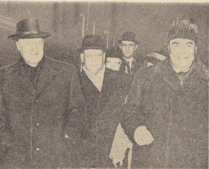
Οι σ. σ. Κάνταρ και Μπρέζνιεφ στό σιδηροδρομικό σταθμό τού Κιέβου

Στό φύλλο της τής Δευτέρας ή «Πράβδα», γράφοντας για τό συνέδριο και τή σημασία του, τονίζει ότι τό κύριο χαρακτηριστικό του είναι ή ένότητα Κόμματος και λαού που θά εκφραστεί πανηγυρικά για (Συνέχεια στήν 4η σελίδα)