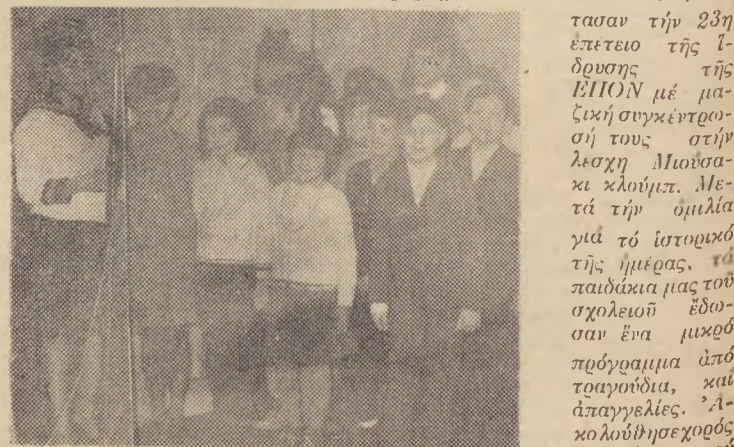
Οι μαθητές πού πήραν μέρος στο πρόγραμμα της γιορτής.

τασαν τήν 23η έπετειο της Ιόδρουσης της ΕΠΟΝ με μαζική συγκέντρωση τους στην Λεσχη Μιούσικ κλουμπ. Μετά τήν όμιλία για τό ιστορικό της ήμέρας, τά παιδιά μας του σχολείου έδωσαν ένα μικρό πρόγραμμα από τραγούδια, και άπαγγελίες. Ακολούθησε χορός και γλεντι πού κράτησε ως τό πρωί.