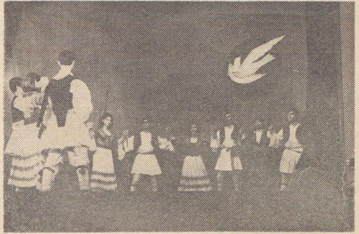
Η χορευτική μας ομάδα του Παραρτήματος Βουδαπέστης

Οι Βο έργοροι φειητις πού σπειράζονται στην Λεϊόπολιτ οργάνωσαν τό περασμένο Σοββατίβερο στην οίδια Κελλίσις «Ιεεργκι Ντιμτροφ» μιά όρεία καλλιτεχνική βροδιά στην όπλα κάλειςον να πάροον μ ιερος οί καλλιτεχνικς ομάδες και άλλαν έιαν φειητιάν πού σπονδάζουον στην Βουδαπιση έτοι πού ή καλλιτεχνική αυτή βροδιά μαζί με τό καλλιτεχνικό της πρόγραμμα τιά έίαι τοιτε χείρια και μιά άραία εκδήλωσή της φιλιος και της άλληλεγγής τάν λοάν για τήν είεξη και τήν πρόοδο του κόσμου. Μιόλι με τα ειητιεριο τάν Ιειη έρεων φειητιών και μαθητών, και πολλών άλλων έιαν φειητιάν, στην βραδιά αυτή πήραν μέρος ή χορω όια μας και ή χορευτική ομάδα του Παραρτήματος μας της Βουδαπέστης. Καί οί δέο ομάδες μας έδασαν τό πρόγραμμά τους με μεγάλη έπιτυχία και τό κοινό καταχειροκρότησε τά τραγούδια πού τραγούδησαν και τους λαϊκούς χορούς πού χόρεψαν.