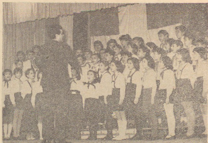
Οι μαθητές και μαθήτριες τών δημοτικών σχολείων «Μ. Γλέζος» και «Γιόζεφ Αττίλα» σέ μιιά εμφάνισή τους στη διάρκεια τού καλλιτεχνικού προγράμματος που έδωσαν στή Βουδαπέστη για τήν εθνική μας γιορτή

Σέ ατμόσφαιρα που κυριαρχούσαν από εθνική περηφάνεια και πατριωτικό και αγωνιστικό παλμό γιορτάστηκε φέτος από τούς πολιτικούς πρόσφυγες μας ή επέτειος τού μεγάλου Εικοσιένα.