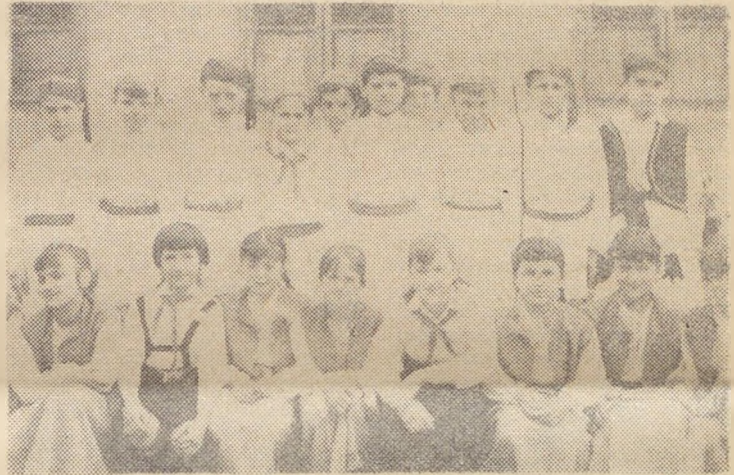
Τά παιδιά πού πήραν μέρος στο πρόγραμμα

Η διεύθυνση του σχολείου μας «Μανώλης Γλέζος» οργάνωσε στις 25 του Μάρτη γιορτή προς τιμή της επετείου του Εικοσιένα. Όπως κάθε χρόνο ή προετοιμασία του γιορτασμού είχε αρχίσει από τίς δασκάλες μας πριν από αρκετές βδομάδες.