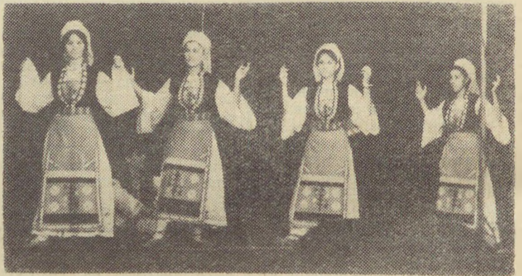
Женската играорна група од с. Белояние

Не е еднаква можноста за изразување на притежавање при различните лица. Така, на пример, за 1—о и 2—о лице притежавање може да се искаже по два начина, со две кратки местоименски форми: Јас казав на мајка МИ (—на МОЈАТА мајка); и Јас казав на мајка СИ (—на СВОЈАТА мајка); Ти каза на мајка ТИ (—на ТВОЈАТА мајка) и Ти каза на мајка СИ (—на СВОЈАТА мајка). Но, за 3—то лице притежањето се изразува само по еден начин—со кратка местоименска форма, кога објектот е и притежавање на