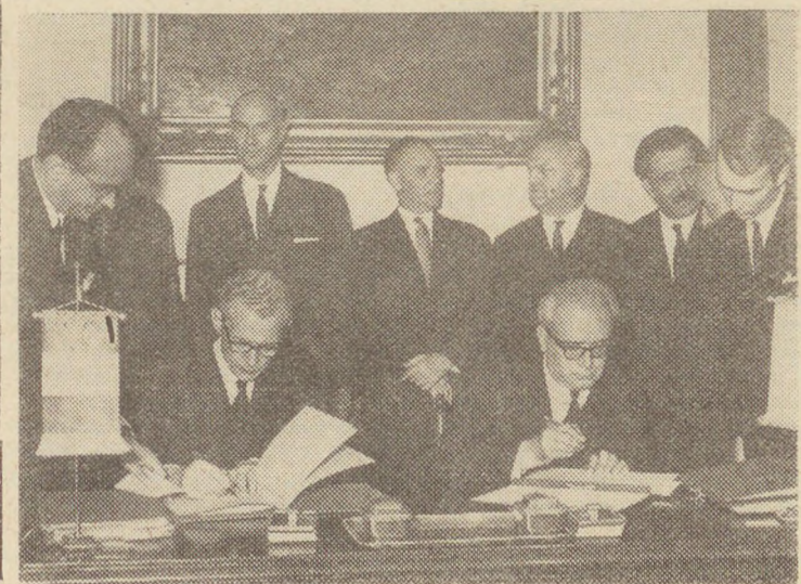
Η υπογραφή της Ουγγρογαλλικής Συμφωνίας

Λόγω της συμπεριφοράς και της άποραριστικής δράσης της Γαλλίας και των σοσιαλιστικών χωρών η ιδέα της ειρήνευσης της Ευρώπης (Συνέχεια στην 4η σελίδα)