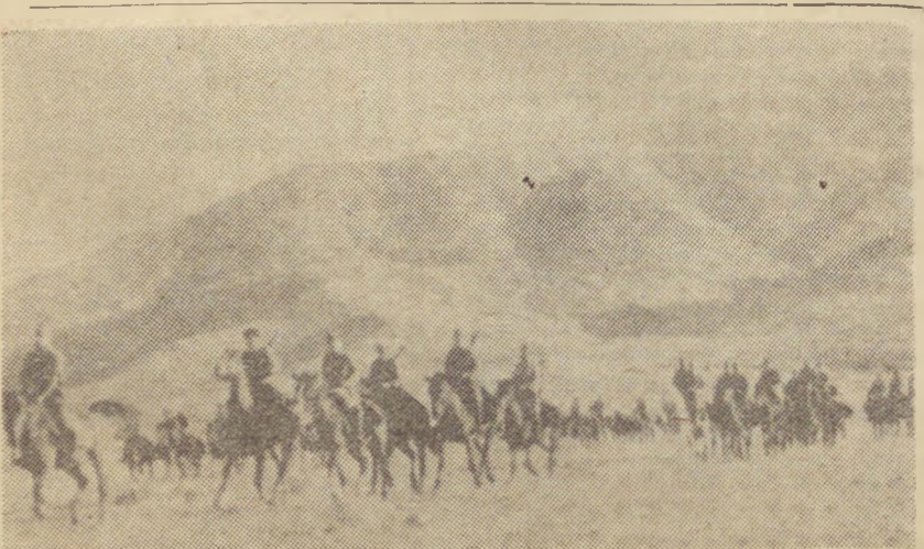
Έπέλαση ίππικού του ΕΛΑΣ. Αρκετοί από τους συναγωνιστές μας, πολιτικούς πρόσφυγες στην Ουγγαρία, έχουν υπηρετήσει στο δοξασμένο ίππικό του ΕΛΑΣ