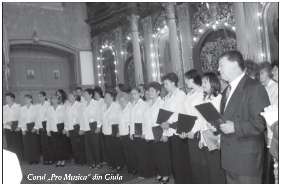
Corul „Pro Musica” din Giula