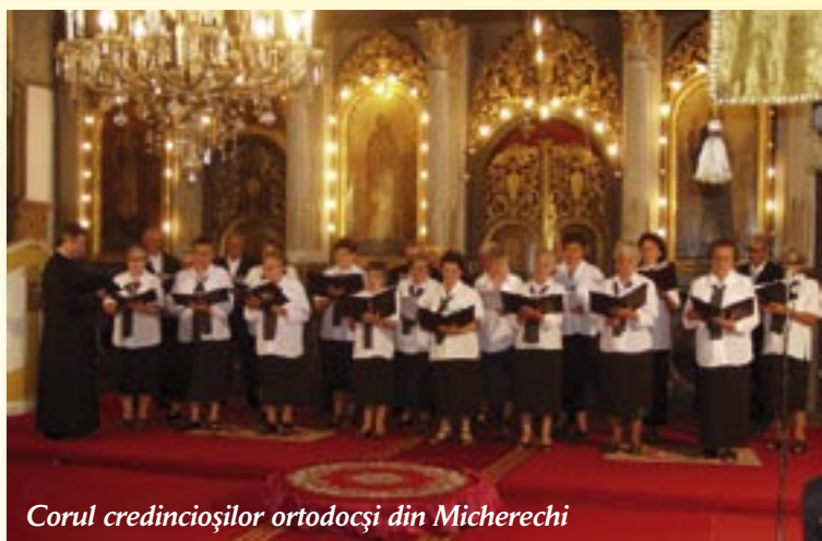
Corul credincioșilor ortodocși din Micherechi