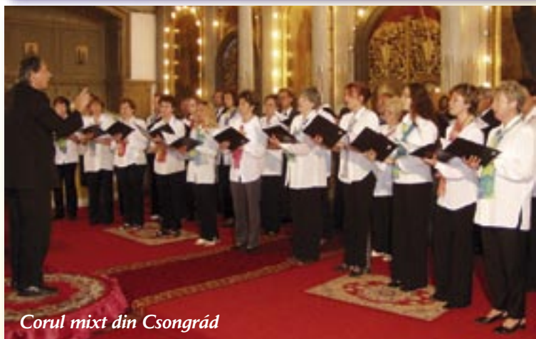
Corul mixt din Csongrád