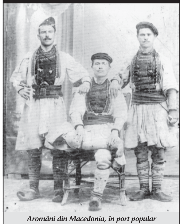
Aromâni din Macedonia, în port popular