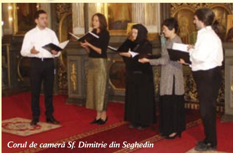
Corul de cameră Sf. Dimitrie din Seghedin