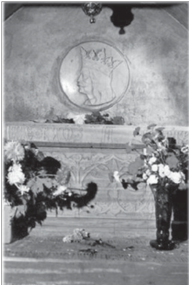
Mormântul în care odihnește marele domnitor

Voievod – lat. „dux”, conducător suprem al țării, conducător de oști;