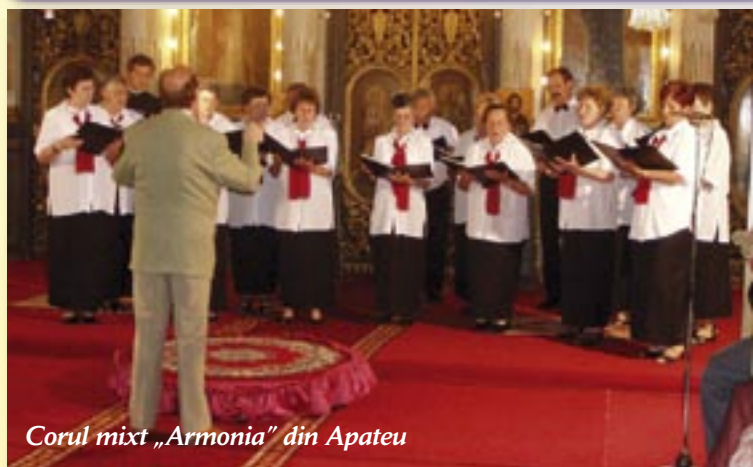
Corul mixt „Armonia” din Apatou