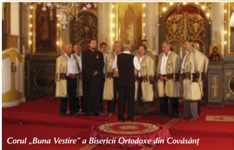
Corul „Buna Vestire” a Bisericii Ortodoxe din Covăsânț