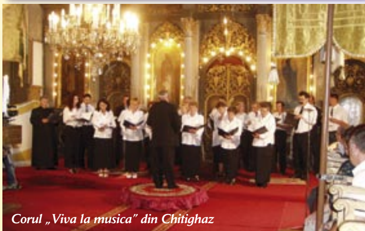
Corul „Viva la musica” din Chitighaz