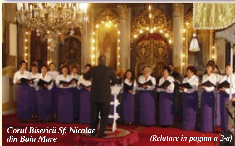
Corul Bisericii Sf. Nicolae din Baia Mare