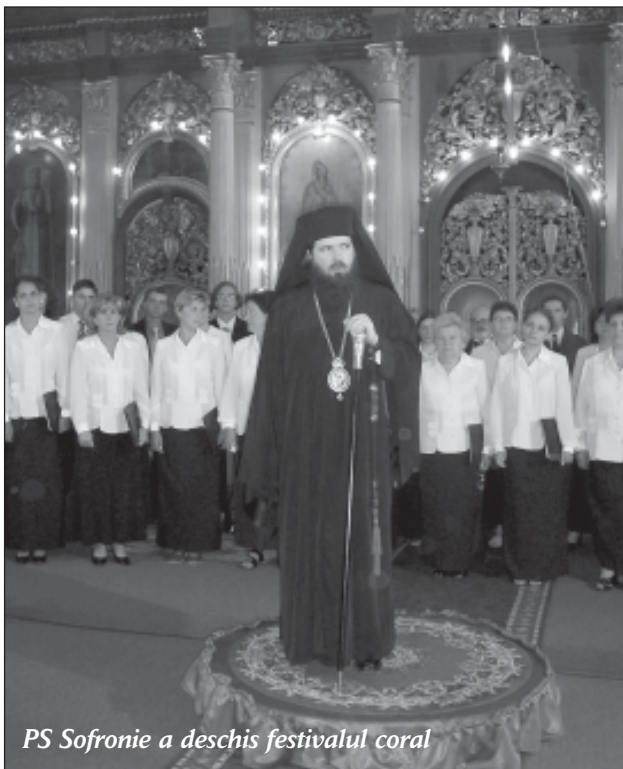
PS Sofronie a deschis festivalul coral