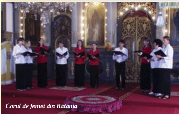
Corul de femei din Bătania