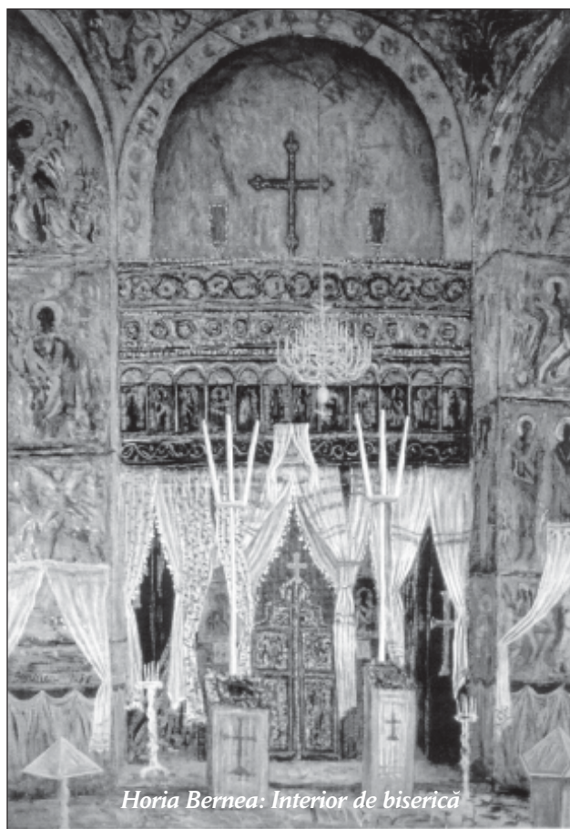
Horia Bernea: Interior de biserică