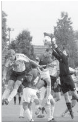
Una dintre fazele periculoase ale bățanienilor