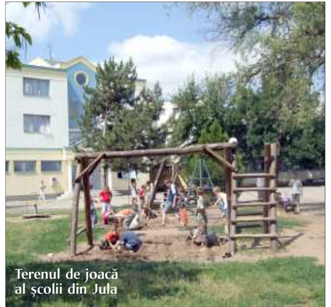
Terenul de joacă al școlii din Jula