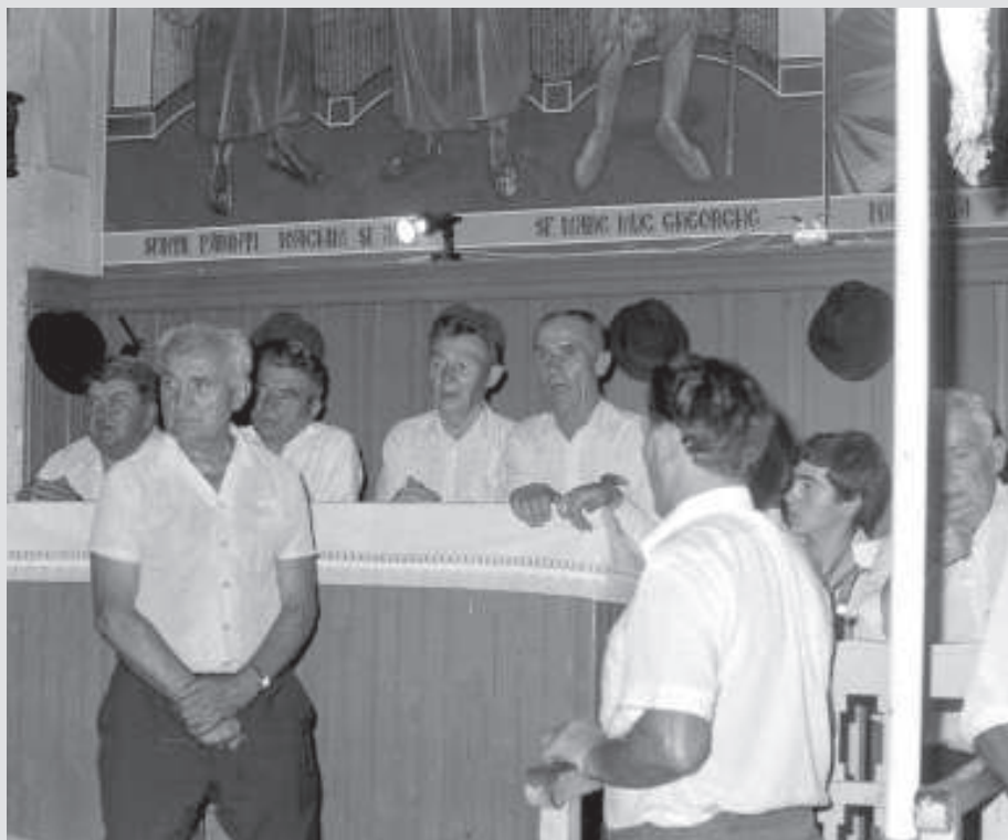
Strana din biserica ortodoxă din Micherechi, în 1990