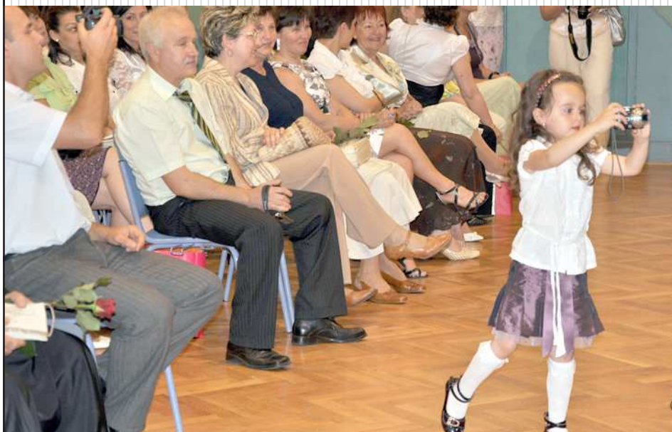
Un viitor fotoreporter...

Părerile autorilor nu coincid întotdeauna cu opinia Redacției. Responsabilitatea juridică pentru conținutul articolelor publicate în Foia românească aparține autorilor. Foia românească nu garantează publicarea textelor nesolicitate de redacție.