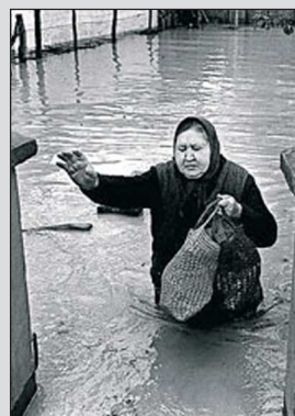
Imagini de la inundațiile din 1970