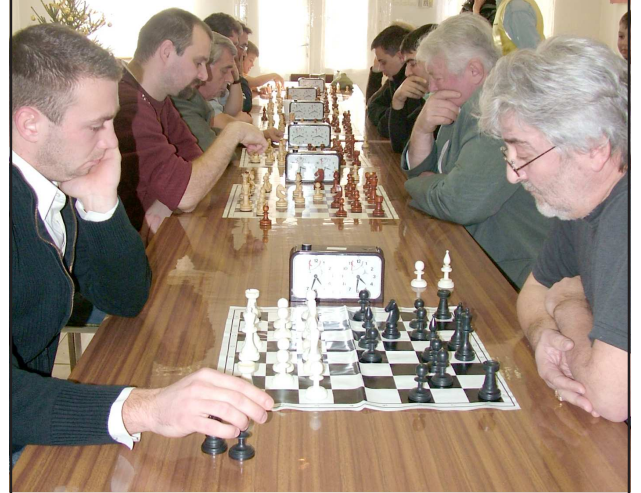
Imagine de la concursul din decembrie 2009

2006 (Germania): Cei 23 de jucători de la Coasta de Fildeș jucau la echipe din străinătate ♦ Ecuadorianul Lara, cel mai scund jucător (1,62 m) iar cehul Koller cel mai înalt (2,02 m) și cu cele mai multe kilograme (100 kg)