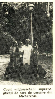
Copii micherecheni supravegheați de sora de ocrotire din Micherechi.

Între locuitorii celor două comune românești, în decursul celor 6 zile cît au trăit alături, au avut loc multe convorbiri cu caracter familial, dar mai ales pe teme din domeniul agriculturii. În cadrul schimbului de păreri au avut ocazia să învețe unii de la alții multe lucruri folositoare cu caracter practic. Astfel micherechenii au avut ocazie să cunoască gospodăriile bine întreținute ale locuitorilor din Chitighaz, locuințele lor moderne, înzestrate cu toate aparatele tehnice moderne, iar localnicii au cunoscut felul de grădînit al micherechenilor, cu folosi-