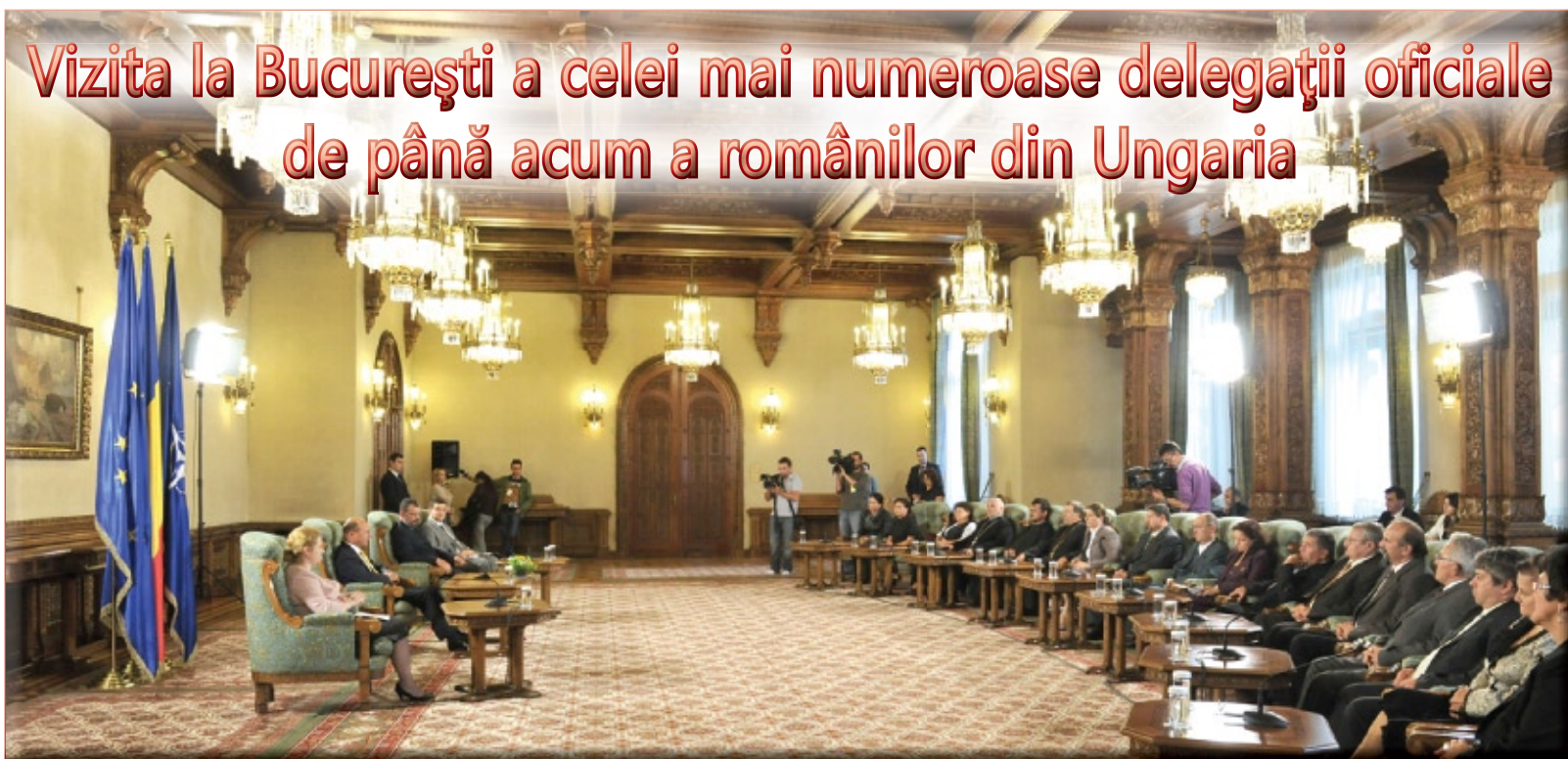
Președintele României, Traian Băsescu, îl salută pe deputatul parlamentar Gheorghe Șimonea