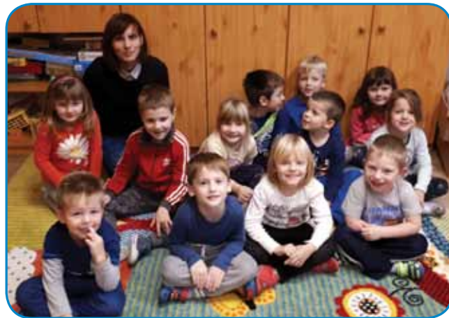
V vrtcu smo vsi dobre volje (Vrtec Gornji Senik)

ustvarjanja, pa tudi telovadbe in gibanja. Opažam, da vse to zelo spodbudno vpliva na njihovo učenje slovenščine in da si otroci tako hitreje in lažje zapomnijo besede in besedne zveze, morda tudi cele stavke. Tudi sicer otroke večkrat spod-