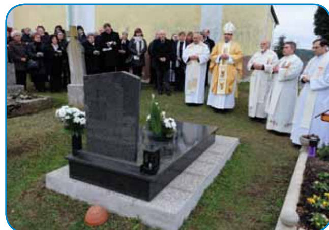
Po svetof meši pri grobi pokojnoga župnika