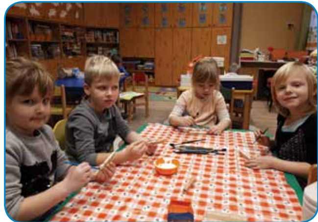
Likovno ustvarjamo (Vrtec Gornji Senik)

V vrtcu smo vzgojiteljice in varuhinje tiste, katerim so otroci zaupani v varstvo in vzgojo.