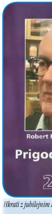
Hkrati z jubilejnim