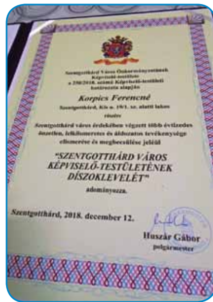
Časna diploma za delo v Trauščaj

»Oni so vsakšoma mala taum, »Sprvoga se tak šika, ka obadva gospauda, kaplana tü furt pozove-