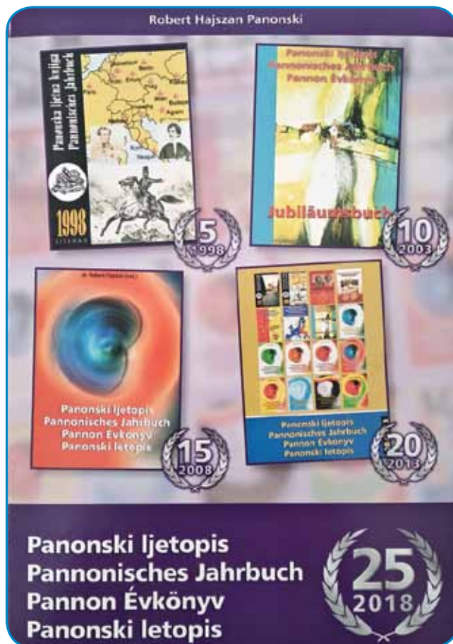
Naslovnica Panonskega letopisa z jubilejno številko 25 in letnico 2018, naslednji zbornik pa naj bi izšel z letnico 2020