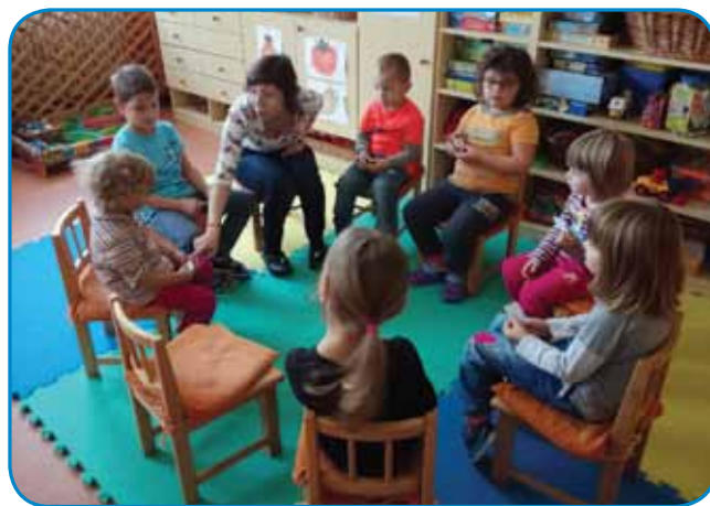
Med malčki v Sakalovcih

Že tretje šolsko leto kot vzgojiteljica asistentka obiskujem porabske vrtce in malčke učim slovenski jezik. Otroci so v predšolski dobi kot »gobe«, ki vsrkavajo nove informacije, zato sem mnenja, da so otroci že zelo zgodaj sposobni in pripravljeni za učenje jezika. Za nami je lepo leto, polno novega znanja in izkušenj. Jezik sem otrokom približala na preprost in zabaven način, skozi igro. Zanje pripravljam raznolike dejavnosti, kot so: gibalne in rajalne igre, deklamacije, prstne igre, izštevanka, pesmice,