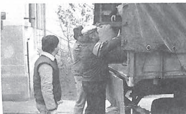
Camionul plin cu alimente este gata de drum spre România