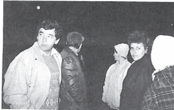
In așteptarea noului transport — tot acolo