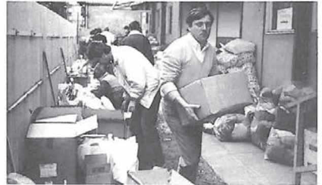
Centrul de colecționare a ajutoarelor din strada „O” a capitalei