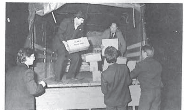
Medicamente și alte produse sanitare din partea cetățenilor din Miskolc