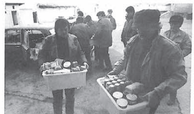
Conserve și alte alimente aduse de cunoscuți și necunoscuți