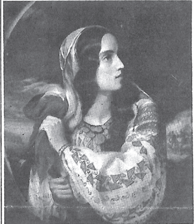
C.D. ROSENTHAL: România revoluționară