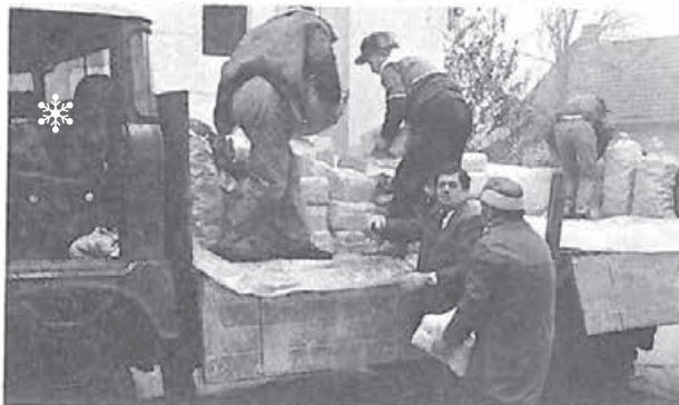
Donațiile micherechenilor și chitighăzenilor au fost aduse la căminul românesc din Giula