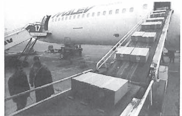
La bordul avionului maghiar: pachete cu medicamente destinate răniților din România