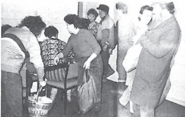
Micherechenii au adunat ajutoarele la sediul sfatului