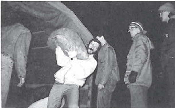
Transbordare din camion in vagon la gara din Giula