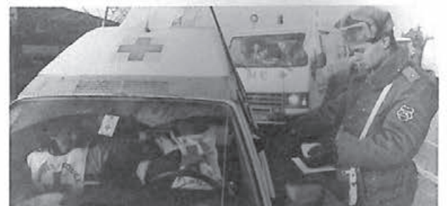
Unitați ale Crucii Roșii în drum spre România, la punctul de frontieră din Nádlaç