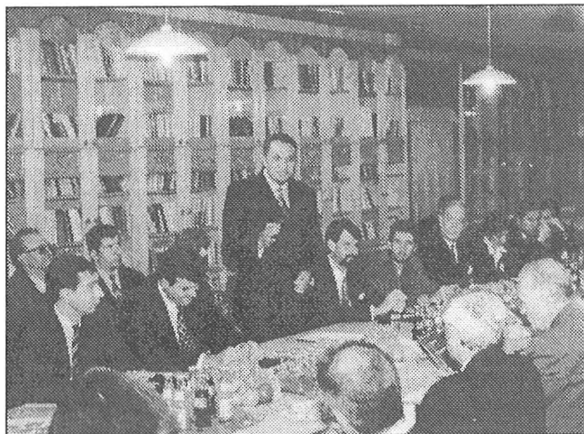
Министър-председателя на Република България Иван Костов по време на посещенията му в Дружеството на българите в Унгария - март 1997 г.