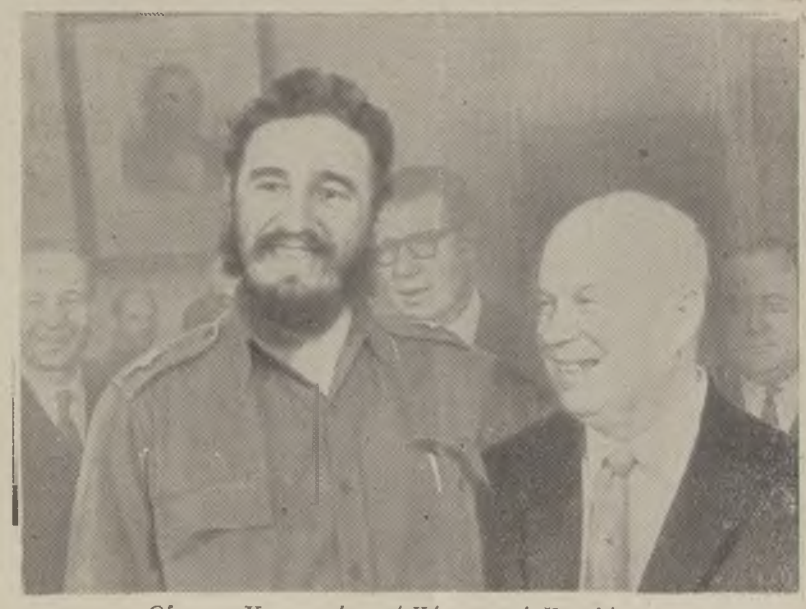
Οί σ. σ. Χρουστσόφ και Κάστρο στο Κρεμλίνο

Τη Δευτέρα τό πρωί τό νέο μοντέρνο κτίριο τό άεροδρομίου του Βνούκοβο στη Μόσα ήταν γεραστικά διακοσμημένο με σοβιετικές και κομβανέζικες σημαίες, με έπιγραφές σε ρωσική και σε ισπανική γλώσσα. Ταυτόχρονα μεγάλο πλήθος Μοσχοβιτών άρχισε να συγκεντρώνεται για να χαιρετίσει τον πρωθυπουργό της Κούβας Φ. Κάστρο που έρχονταν στη σοβιετική πρωτεύουσα ύστερα από πρόσκληση του πρωθυπουργού Ν. Χρουστσόφ.