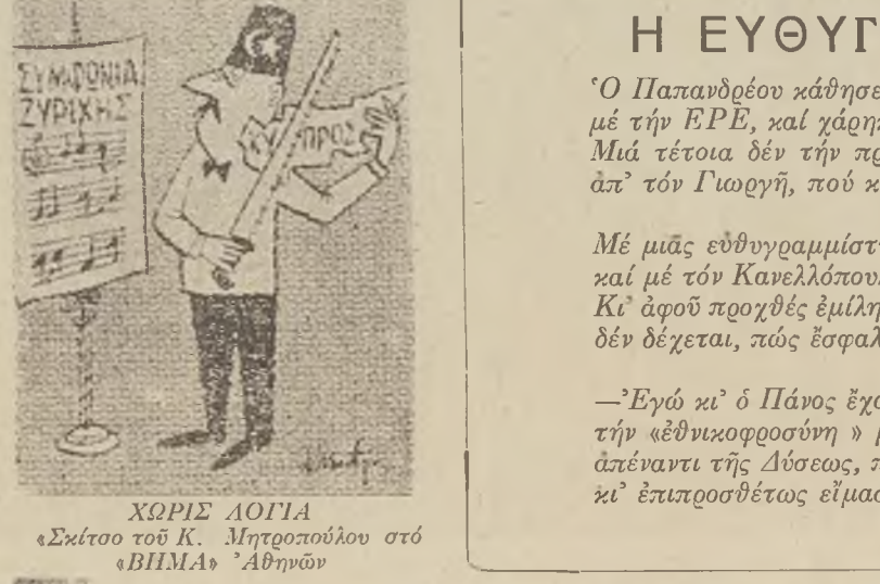
ΧΩΡΙΣ ΛΟΓΙΑ «Μάιστο του Κ. Μητροπούλου στο ΒΗΜΑ» Αθηνών