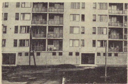
Στη φωτογραφία: Μιά από τις μοντέρνες πολυκατοικίες της όδου Κάτιου Πόγκρατς

Μέσα στο χρόνο αυτόν ένας μεγάλος αριθμός προσφύγων μας που κατοικούσαν στην Κοινότητα Βιομηχανίας της όδου Κέμπανια της Βουδαπέστης εγκαταστάθηκαν σε νέες κατοικίες στα διάφορα διαμερίσματα της πρωτεύουσας. Στο τελευταίο αυτό διάστημα και άρκετο άλλοι συναγωνιστές μας από την ίδια κατοικία πήραν μοντέρνα διαμερίσματα στις νεόκτιστες πολυκατοικίες της όδου Κάτιου Πόγκρατς του ΧΙΥ διαμερισματος, της όδου Χάρματ του Χ διαμερισματος και της όδου Λάκατος ούτελεπ του ΧΥΙΙ διαμερισματος της Βουδαπέστης.