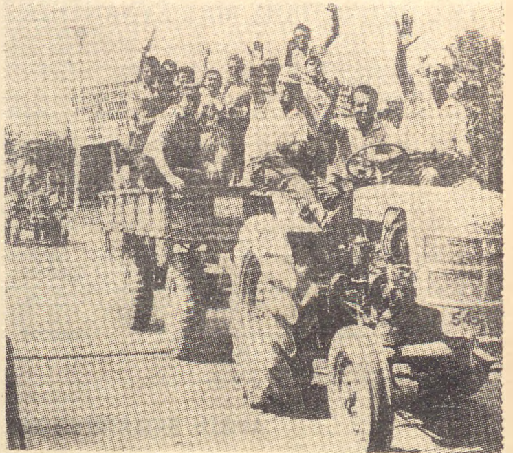
Οι ήρωικοί Έλληνες άγρότες πέρασαν όλα τά φράγματα από σφαίρες, ρόπαλα και δακρυγόνα και μπήκαν στη Θεσσαλονίκη

Ανά ώρες (9—11 π.μ.) κράτησε στη γέφυρα του Φοίνικα αυτή ή σύγκρουση. Στο διάστημα αυτό όλος ο γύρο χώρος, χιλιάδες τετραγωνικά μέτρα, είχε μεταβληθεί σε άληθινό πεδίο πολεμικών συγκρούσεων. Παντού φωτιές, καπνοί και πέτρες, τίς όποιες δέν πετώσαν μό— (Συνέχεια στην 3η σελίδα)