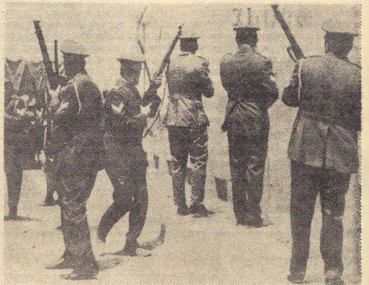
Ο Άποστολάκος διατάζει: «Χτυπάτε στο φαχνό»