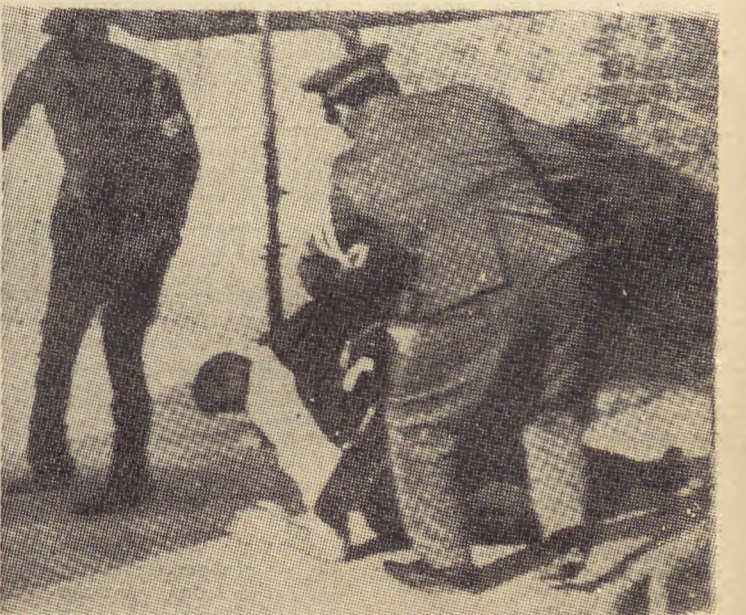
Νά πώς μεταχειρίζεται τούς ειρηνικούς άγρότες ή κυβέρνηση Αύλης—ΕΡΕ