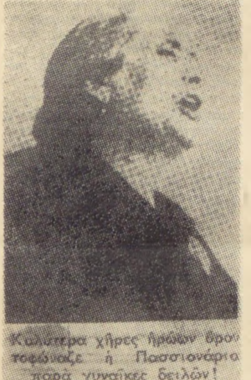
Κυρίατεροι χήρες ήρώων άποπλισμού ή Πασιονάριο παρά γυναίκες δειλών!

Ο Ισπανικός λαός τίμησε προχτές, 18 Ίούλη την 30ή επέτειο της μεγάλης και ηρωικής του αντίστασης στο φασισμό. Μαζί του δλόκληρη η προοδευτική ανθρωπότητα, τιμώντας την μνήμη των χιλιάδων —ηρωϊκών αγωνιστών που έπεσαν, προσαπίζοντας τό νόμιμο καθεστώς της χώρας, διακήρυξε ταυτόχρονα την απειρόριστη άλληλεγγυή της προς τον Ισπανικό λαό, που με όλες του τις δυνάμεις συνε-