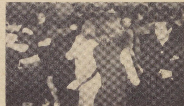
Από τή συνάντηση των νέων μας στήν ψυχαγωγική βραδιά το η περιεχειν Σεφίτιν