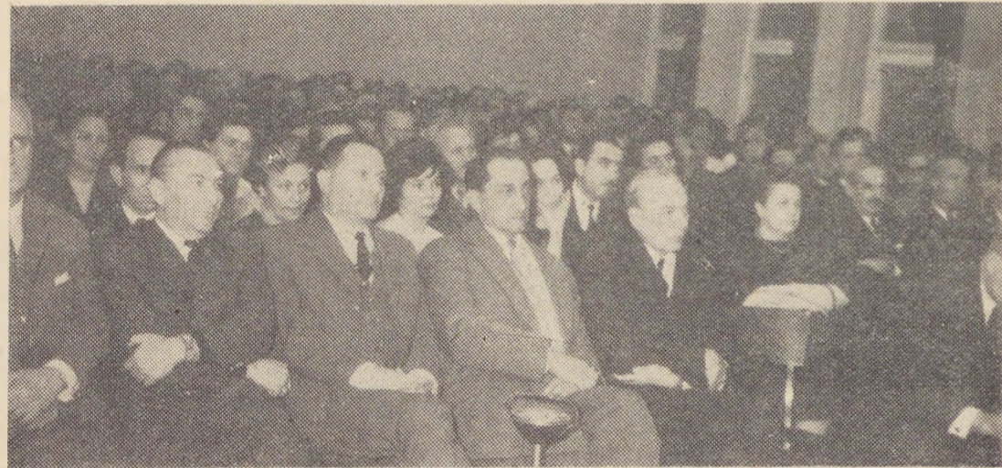
Από τη μεγάλη συγκέντρωση συμπαράστασης στο λαό μας των εργαζομένων στο Ίδρυμα Σχεδίου του ουγγρικού υπουργείου Βαρίας Βιομηχανίας.

κή τους δράση. Ανάμεσά τους είναι και 3 πρώην βουλευτές της Ένωσης Κέντρου».