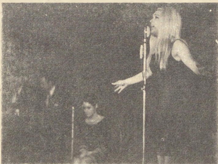
Μιά εικόνα από τό υπέροχο έργο του Γιάννη Ρίτσου.— Μίκη Θεοδωράκη «Επιτάφιος»

Στήν εμφάνιση αυτή οι πολιτικοί πρόσφυγές μας, δίπλα στην μεγάλη καλλιτεχνική χαρά πού θά τούς προσέφερε—είδαν όλα τά στοιχεία μιας εκδήλωσης στενοτάτα συνδεμένης μέ τήν κατάσταση πού μετά τό φασιστικό πραξικόπημα διαμορφώθηκε στην πατρίδα, συνδεμένη μέ τόν αντιδικτατορικό αγώνα του λαού μας καί μέ τήν συμπαράστασή τους στον αγώνα αυτό: «Έλληνες καλλιτέχνες, πού γιά νά αποφύγουν τούς διωγμούς τής Χούντας αναγκάστηκαν νά εκπατριστούν γιά νά θέσουν δημοσ μετά σάν σκοπό τους νά γνωρίσουν σ' όλο τόν κόσμο τή σύγχρονη ελληνική τέχνη, πού ή Χούντα καταδιώκει καί άπειλεί μέ άφανισμό. Πρόγραμμα μέ θανμάσια έργα του Μίκη Θεοδωράκη, του Γιάννη Ρίτσου—των δύο μεγάλων δημιουργών, πού στό παρελθόν οι πρόσφυγές μας γνωρίσαν καί προσωπικά καί πού τώρα ή Χούντα τούς κρατά δέσμιους. (Στή διάρκεια τής πρώτης εμφάνισης του συγκροτήματος έφτασε ή είδηση γιά τήν άπελευθέρωση του Θεοδωράκη). Όνόματα καλλιτεχνών, όπως τής Δώρας Γιαννακοπούλου καί του Γεράσιμου Σταύρου, πού λίγο—πολύ, μάς ήταν γνωστά. Καί προπαντός, ή πολιτική στιγμή, ή καινή ελληνική πραγματικότητα, πού πρόσφερε τό φόντο μέσα στό οποίο θά χαίρετιζαν καί θά χαιρόνταν οι πρόσφυγές μας τούς Έλευθέρους Καλλιτέχνες: Συνέχιση καί ένταση τής φασιστικής τρομοκρα-