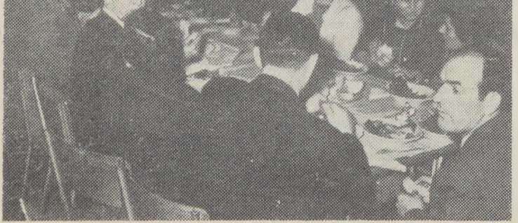
Φωτογραφία από τή βραδιά των κολχόζνικών μας

Τό βράδι του περασμένου Σαββάτου τά μέλη του αγροτικού συνεταιρισμού «Ειρήνη» του χωριού Μπελογιάννης, μαζί με τίς οικογένειές τους και τούς πιό κοντινούς φίλους τους πανηγύρισαν σάν μιά αγαπημένη οικογένεια τίς επιτυχίες του συνεταιρισμού τους στον περασμένο χρόνο. Η δημοφής γιορτή έγινε στήν αίθουσα κουλτούρας του χωριού, πού από νωρίς είχε προετοιμαστεί κατάλληλα. Στίς 7 ή ώρα τά μέλη του συνεταιρισμού και οι προσκαλεσμένοι τους, ανάμεσα σ' αυτούς και εκπρόσωποι των οργανώσεων του χωριού μας και τής Ε.Ε. του Κ. Σ. του Συλλόγου μας, πήραν τίς θέσεις στά καλοστραμένα τραπέζια και ή βραδιά άρχισε με πλούσιο φαγοπότι και μέ ελληνική μουσική. Πέντε καλομαγειρεμένα γουρουνία και κάμποσες εκατοντάδες μπουκάλια μπύρα, μαζί με τή μουσική δημιουργήσαν τήν κατάλληλη άτμόσφαιρα. Μετά τό δείπνο άρχισε ό χορός. Χόρευαν όλοι με καλό κέφι ελληνικούς και εθνοπαϊκούς χορούς. Καί από τούς ελληνικούς χορούς δέν έλειπαν και οι Ούγγροι κολχόζνικοι.