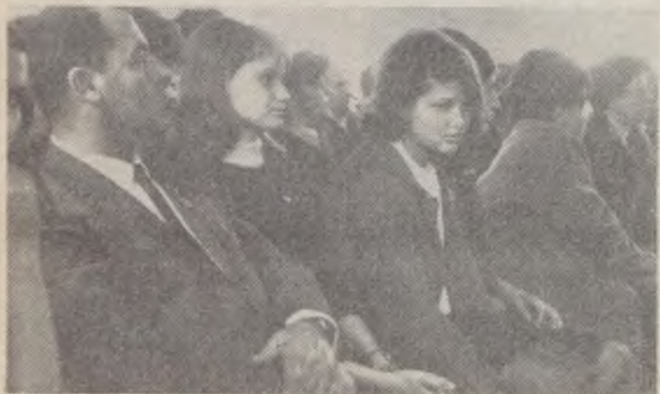
Μία φωτογραφία από τή συνέλευση. Τά μέλη του συνεταιρισμού παρακολουθούν με προσοχή τόν εισηγητή

Από την όραία αυτή εκδήλωση βοήθεια προς τόν βιετναμέζικο λαό, δέν πρέπει νά μένουμε έξω και μεις οι εκπαιτριμένοι Έλληνες νεολαίοι. Έίτε είμαστε μέλη της ΚΙΣ, είτε όχι, έχουμε όλο και υποχρέωση νά συμμετάσσουμε δραστήρια στην εξόρμηση «τρανζιστορ». Πόσο μεγάλη σημασία έχει η συμπαράσταση και βοήθεια σ' έναν λαό που υπερασπίζεται την λευτεριά και άνεξαρτησία του έμεις τό ξέρουμε πολύ καλά. Γι' αυτό μαζί με τούς Ούγγρους νεολαίους άς κάνουμε και μεις τό διεθνιστικό μας καθήκον άνέναντι σ' έναν λαό και μία νεολαία που έχει κατακτήσει την άγάπη και την συμπάθεια όλόκληρης της προοδευτικής ανθρωπότητας. Κ. Π.