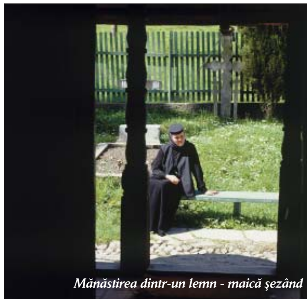
Mănăstirea dintr-un lemn - maică șezând