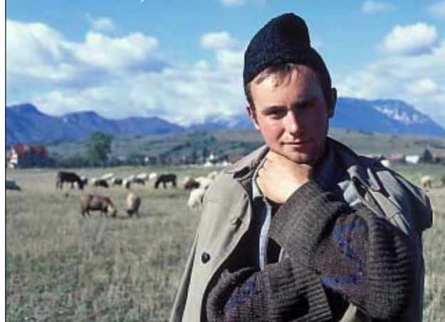
Bran – ciobănaș

aceste chipuri de oameni ponoșiți, cu dinții stricați, cu obraji brăzdați de cute țepoase, cu fire de păr înțepenite de o transpirație urâtă, solidificată într-un soi de osânză, ca de animal, ceea ce vedem este aruncarea-în-față a ceva contondent – ceva care zgârie, care ne sună strident, care jenează, care ne somează. Înțelegi