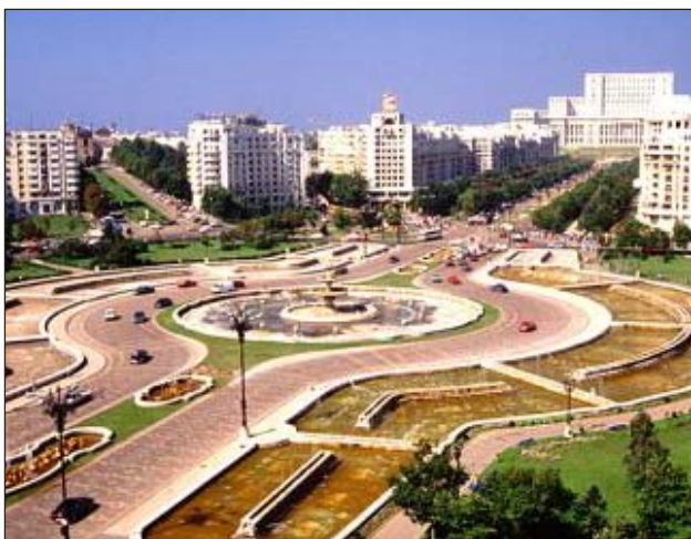
Piața Unirii din București

Cooperare întărită. Expresia desemnează un aranjament prin care un grup de state membre UE (cel puțin opt) pot colabora într-un domeniu precis, chiar dacă restul țărilor Uniunii nu doresc să se alature imediat. Acestea din urmă au însă posibilitatea să se alature ulterior.