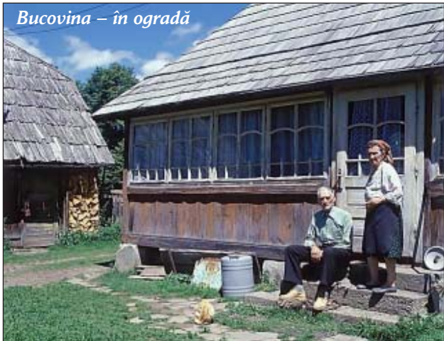
Bucovina – în ogradă