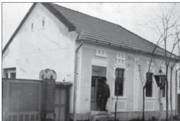
Casă din Turnu (fotografie de arhivă)