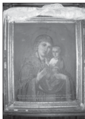
Icoană din biserică românească