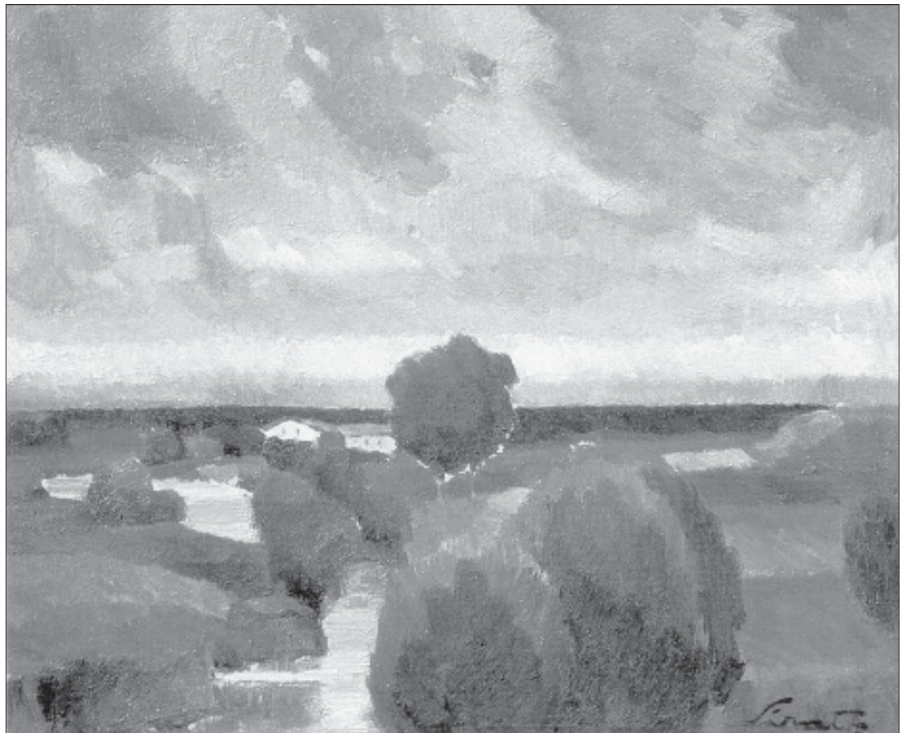
Francisc Șirato: Piesaj