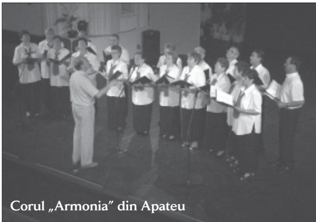
Corul „Armonia” din Apatou

În primăvara acestui an, pensionarii din județul Bihor au organizat, în patru locuri, semifinalele concursului „Cine ce știe?”. Zilele trecute, la restaurantul „Arany Bika” din Dobrițan s-au desfășurat concursurile finale. La acestea au participat și Corul Clubului Pensionarilor din Săcal, și cele două coruri din Apatou. Corul