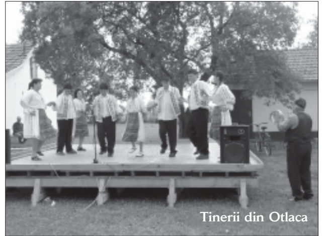
Tinerii din Otlaca