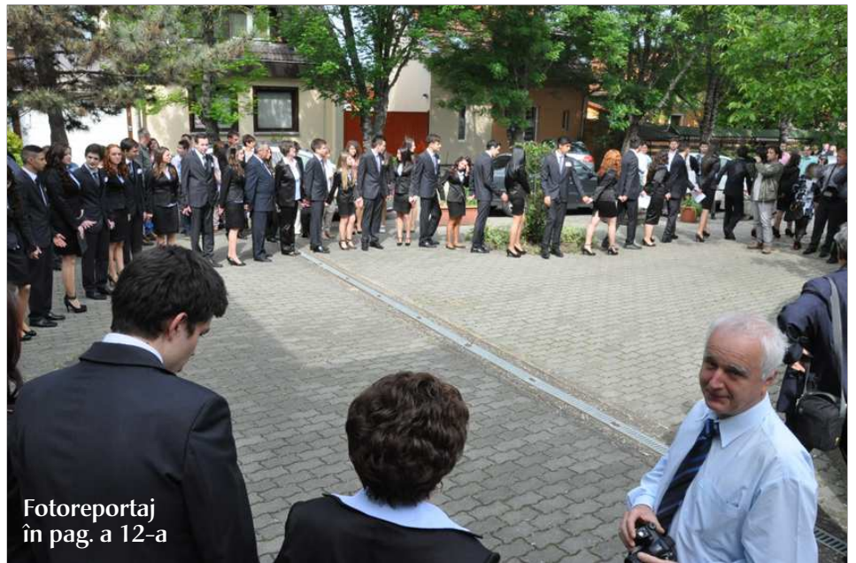
Fotoreportaj în pag. a 12-a

„Pe marea vieții veți călători când cu sufletul plin de bucurii, când cu inima întristată. Veți călători când curajoși, când lipsiți de speranțe, când plini de ambiții mari, dar totodată uneori și de plângeri. Atunci să vă vină în minte mesajul poetului român, să vă vină în minte mersul pe valuri în picioare”, a spus în cuvântarea sa directoarea liceului, care i-a mai sfătuit să nu uite rugăciunea seninătății: „Doamne, acordă-mi seninătatea să accept lucrurile pe care nu le pot