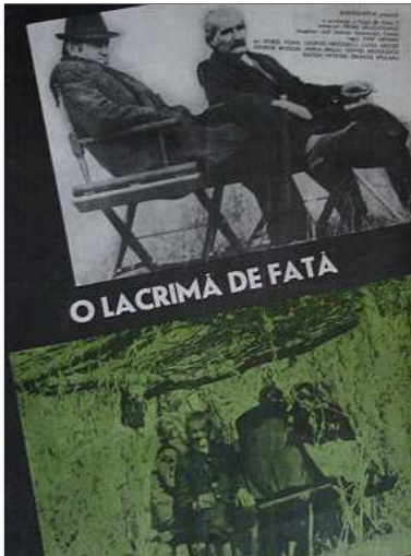
O lacrimă de fată Sâmbătă, 10 mai, ora 11.00, TVR Internațional

Găsirea cadavrului unei fete înecate declanșează ancheta autorităților locale, care ajung la concluzia că este vorba de un accident. „Dialogul dintre cele două priviri, privirea cu ochiul liber și privirea cu lupa telescopică a aparatului, dialogul dintre cele două mijloace de cercetare, constituie adevărata dramaturgie a acestui film, sursa tensiunii din subtext, a unui interes care depășește curiozitatea pentru story-ul presupunerii.”