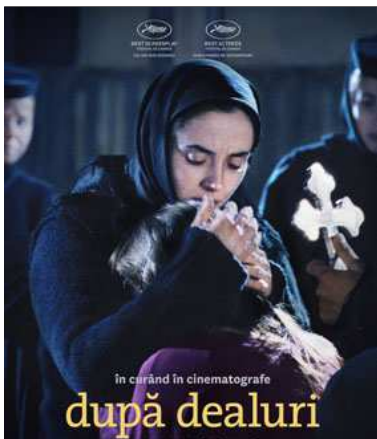
După dealuri Sâmbătă, 10 mai, ora 23.00, HBO

Găsirea cadavrului unei fete înecate declanșează ancheta autorităților locale, care ajung la concluzia că este vorba de un accident. „Dialogul dintre cele două priviri, privirea cu ochiul liber și privirea cu lupa telescopică a aparatului, dialogul dintre cele două mijloace de cercetare, constituie adevărata dramaturgie a acestui film, sursa tensiunii din subtext, a unui interes care depășește curiozitatea pentru story-ul presupunerii.”