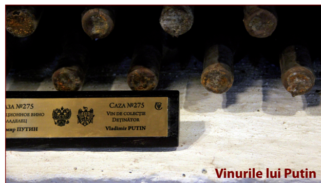
Vinurile lui Putin