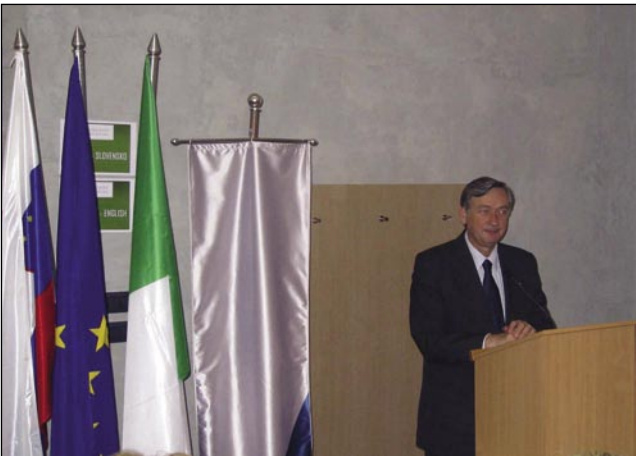
Častni pokrovitelj konference, predsednik RS dr. Danilo Türk

spoštovanju drugih jezikov in kultur. Idealen laboratorij za raziskovanje takega sobivanja in učenje o njem predstavljajo območja, kjer večinski narodi živijo skupaj s pripadniki ene ali več manjšin in kjer vsakodnevno prihaja do kulturnih, etničnih in jezikovnih stikov ter prepletanj in vplivov. Slovenija ima s tem bogate izkušnje, saj na njenem teritoriju živijo avtohtone in druge manjšine, prav tako pa so Slovenci manjšina v sosednjih državah kot tudi drugod po svetu. S tem v zvezi se postavljajo različna zanimiva vprašanja, na primer o položaju (pravnem, jezikovnem) manjšin v Sloveniji kot tudi pripadnikov slovenske manjšine v sosednjih državah in po svetu. Vprašanja jezikovnega položaja in izobraževanja manjšinskih skupnosti je želela osvetliti mednarodna dvodnevna znanstvena konferenca z zgornjim naslovom, sredi septembra na Fakulteti za humanistične študije (FHŠ) v Kopru . Soorganizatorji konference pa so med drugim bili še Inštitut za narod-