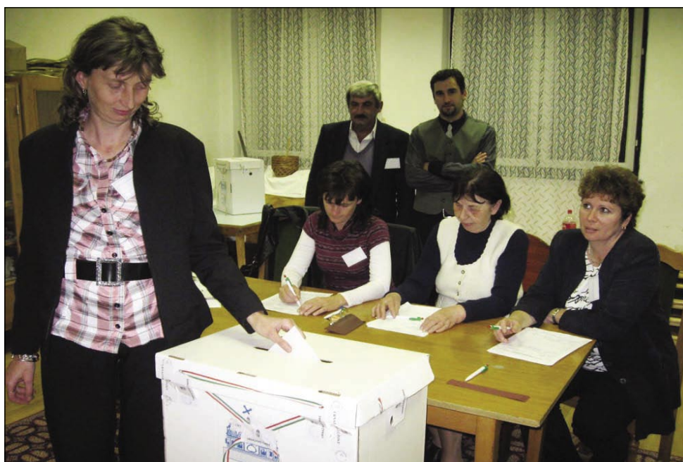
Volitve v Števanovci

Po cejlom rosagi je kauli 47 procentov volivcov šlau volit, tau je menja, kak ji je šlau pred štirimi (53 %) pa pred osmimi (51%) lejtami. Dapa tau je tō nej bilau vsepovsedik gnako, največ lidi je šlau volit na vzhodnom tali države, najmenje pa v županiji Pešt. Kakoli so čedni politični analitiki pravli, ka pri tej volitvaj so nej telko pomembne stranke (pártok), so se zatok strankarske preference pokazale pri varašaj pa županijski skupščinaj (megyei közgyűlés) tō. Mirne dūše leko povejmo, ka je volitve daubo FIDESZ, v vsej devetnajset županijski skupščinaj de emo največ lidi. Tau valá za budimpeštansko skupščino tō. Do spremembe je prišlo pri prvom človeki Budimpešto