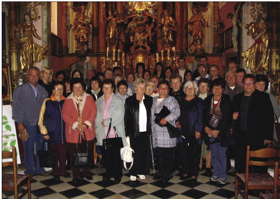
Sakalovski romarji v cerkvi na Sladki gori

Na koncu naše poti smo se še ustavili v Murski Soboti v Intersparu, vsak je kupil kaj za domače, potem smo se srečno vrnili domov. Čeprav je cel dan deževalo, nas to ni prav nič motilo, imeli smo se lepo in vzdušje na avtobusu je bilo zelo veselo, posebej v zadnjem delu avtobusa.