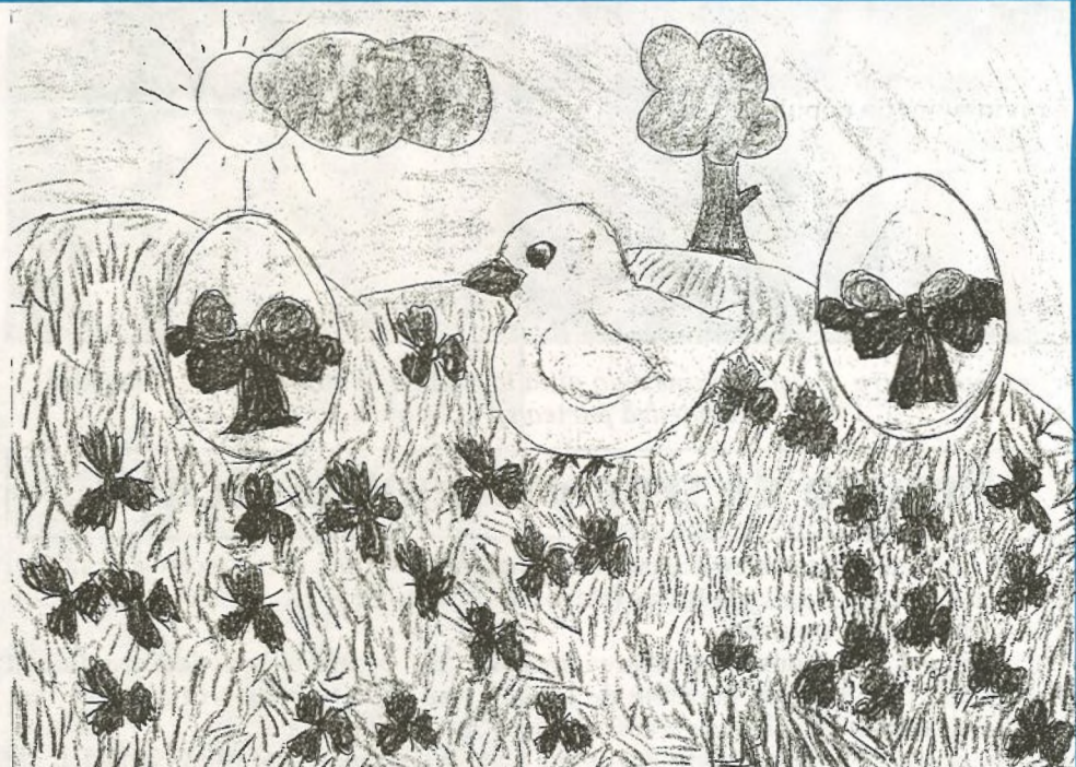
Desen de Andrea Botta (cl. a 4-a)