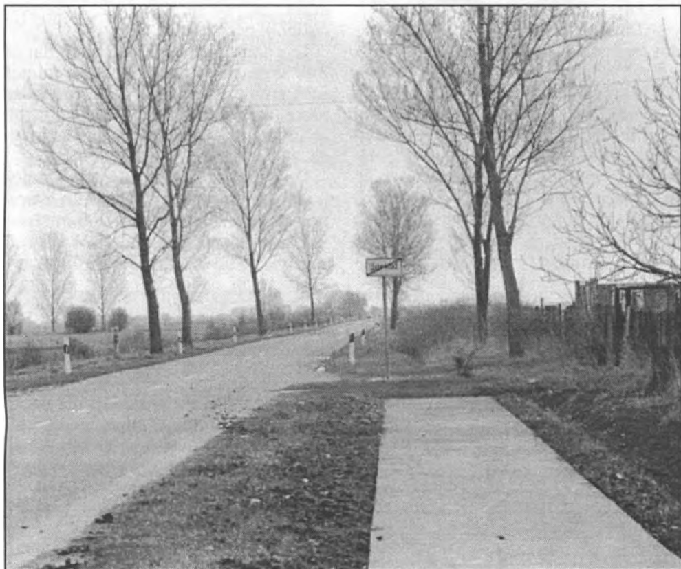
Drumul pentru cicliști a ajuns deja pînă la tabla de hotar a orașului Sarkad, urmează partea spre Salonta