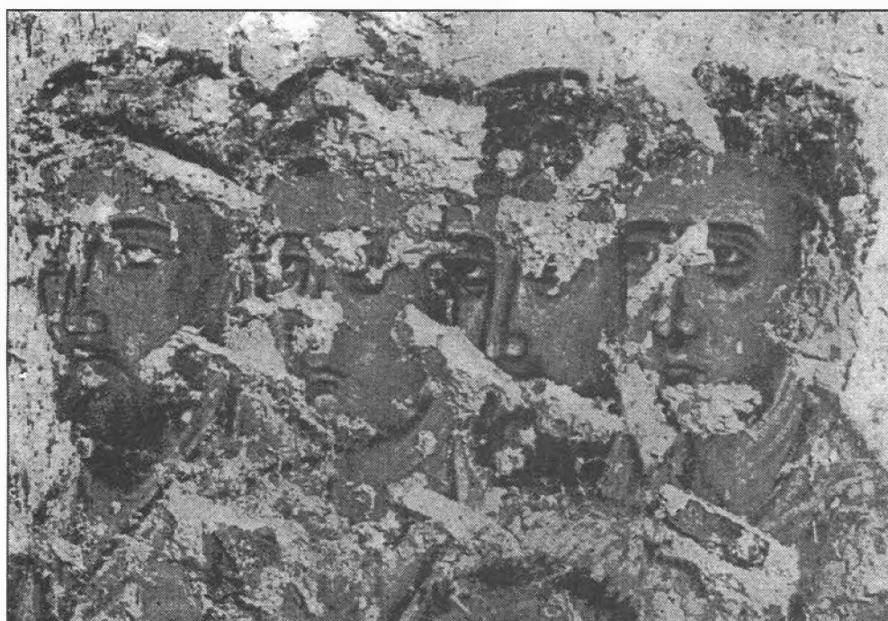
Biserica, Adormirea Maicii Domnului din Hălmașiu din jud. Arad; fragment de piatră murală

Tratatul româno-ungar conține prevederi referitoare la drepturile și obligațiile persoanelor care aparțin minorității române din Ungaria și cele maghiare din România, avînd ca