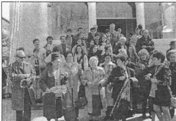
În fața bisericii Sf. Gheorghe din Curtea de Argeș