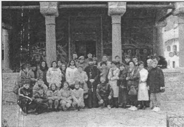
În curtea Mănăstirii Cozia