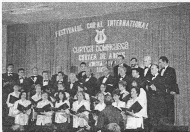
Corul Horodia din Grecia