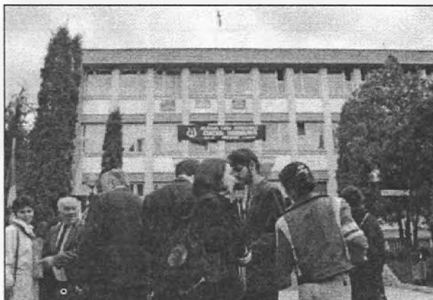
Înainte concertului de duminică