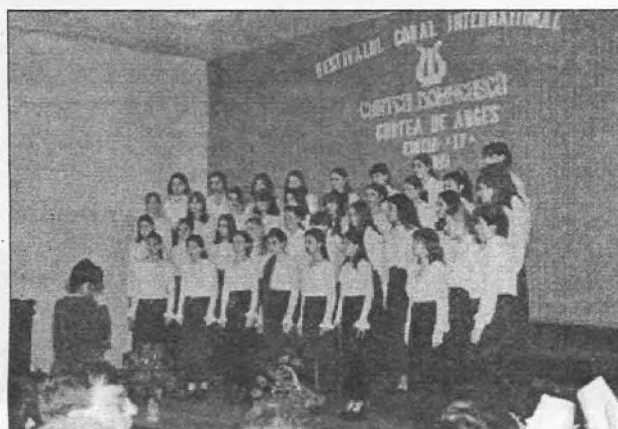
Corul fetelor din Moldova