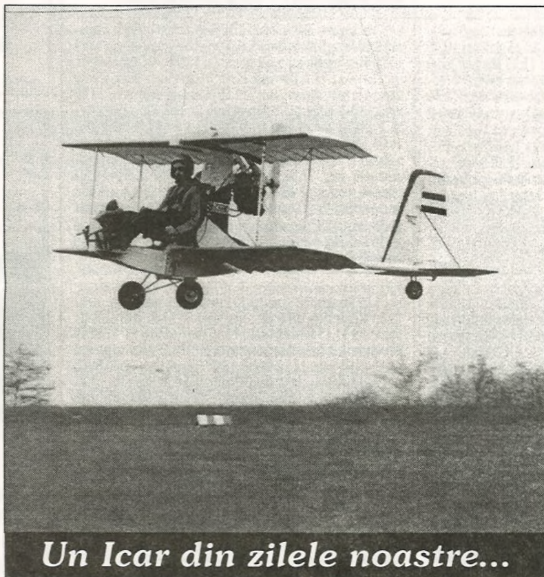
Un Icar din zilele noastre...

Medicii au spus de nenumărate ori că risul este sănătos. Același lucru susține și psihologul A. Frey, de la Universitatea din Stanford. Potrivit cercetărilor sale, 20 de secunde de ris au aceleași efecte benefice asupra inimii ca un exercițiu fizic cu o durată de 3 minute. Efectele sale benefice se extind asupra mușchilor feței, pieptului și abdomenului, umerilor, gîtului... Specialiștii consideră că risul este un mijloc anxiolitic și regenerativ.