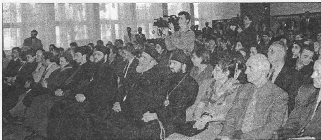
Publicul însuflețit al festivalului