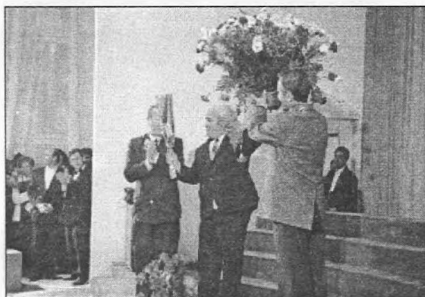
Înmînarea diplomelor și a florilor