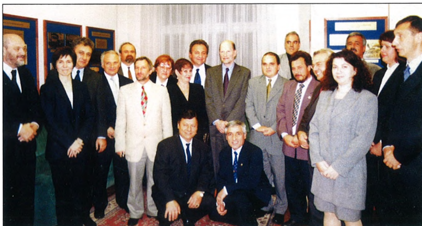
(Симеон Сакскобургготски с членовете на БРС)

На 9 ноември министър-председателят посети Българското републиканско и Столично българско самоуправление на ул. "Лоняи" 41. С него бяха българският посланик в Унгария Светлозар Панов, унгарският посланик в България д-р Бела Коложи и съветникът на българското посолство Емил Гендов. Симеон Сакскобургготски бе сърдечно посрещнат от председателя на Републи-