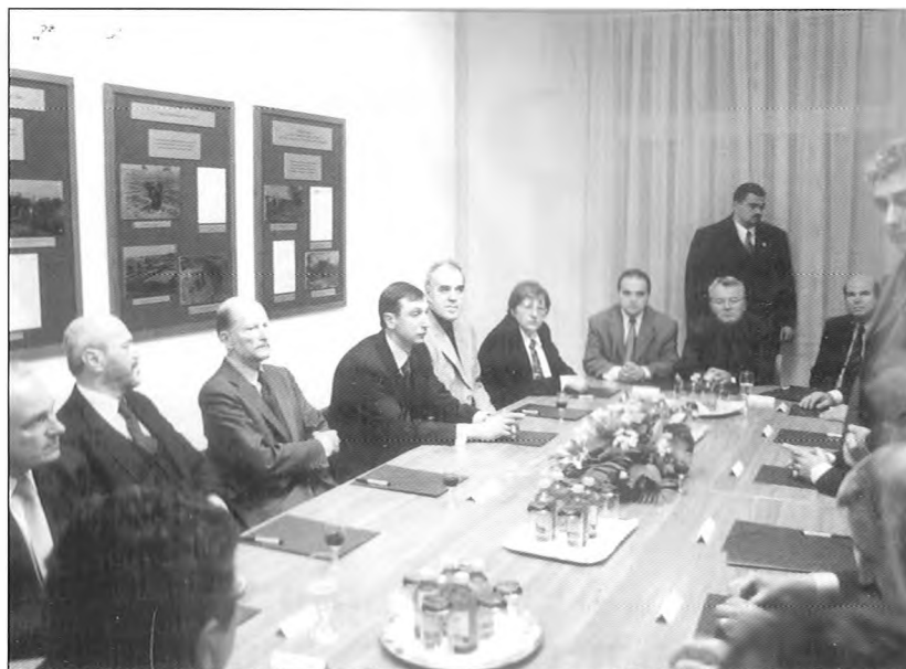
(Симеон Саксбургготски с членовете на БРС)

След посещението в Българското републиканско самоуправление министър-председателят Симеон Саксбургготски се срещна с възпитаниците и преподавателите на Българо-унгарското средно езиково училище "Христо Ботев".